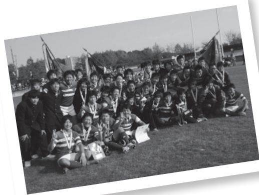
決勝戦後、同じ写真におさまった2校のメンバー。

結果、優勝候補とされていた磐城高校が抽選で準決勝への出場権を得ました。安達高校の選手たちにとっては、ある意味「非情」な抽選でした。負けなかったのに……終わってしまったのです。